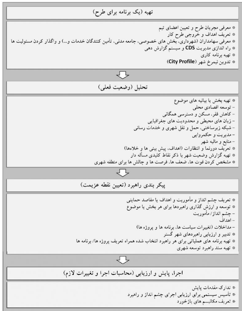
شکل ۱. نمودار فرایند استراتژی توسعه شهری؛ ماخذ: (Cities Alliance, 2011, p.17).

طراحی و برنامه ریزی CDS هر شهری به ویژه در نواحی کلان شهرها معمولاً دارای این مراحل است: ۱- آماده سازی و تدارک؛ ۲- تجزیه و تحلیل؛ ۳- تعریف راهبرد؛ ۴- اجرا؛ و ۵- مشاوره و استفاده مؤثر از بازخوردهای برنامه (Marull, 2007, p.16). در نمودار شماره ۱، این فرایند به تفصیل بیان شده است. ۳- بررسی سابقه طرح موضوع استراتژی توسعه شهری (CDS) در نظام شهرسازی ایران سابقه تفکر این طرح‌ها در ایران در اوایل دهه ۱۳۸۰، با مشارکت وزارت مسکن و شهرسازی و بانک جهانی و با اهداف بهبود وضعیت مسکن جهت ارزیابی و بررسی سیاست‌های بخش مسکن؛ و هدف دیگر بهسازی شهری جهت ساماندهی حاشیه نشینی آغاز گردید. به عبارت