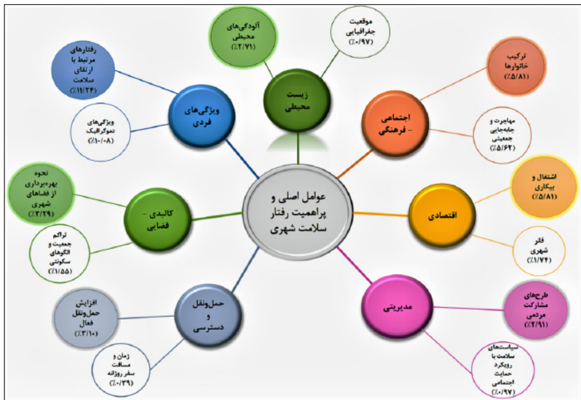
شکل ۳. مدل مفهومی عوامل شش‌گانه رفتار سلامت شهری

انسجام خانوادگی، مهاجرت، حس تعلق مکانی و تعاملات اجتماعی هنوز نقش پررنگ‌تری در تعیین سبک زندگی ایفا می‌کنند. به بیان دیگر، در حالی که رویکردهای جهانی بیشتر از منظر «محیط، رفتار را شکل می‌دهد» به مسئله نگاه می‌کنند، یافته‌های این پژوهش تأکید دارد که در بافت‌ها، «تأثیر کیفیت روابط بر سلامت افراد» نقشی محوری و تعیین‌کننده ایفا می‌کند و این نکته، ضرورت بازنگری در سیاست‌های سلامت شهری را از تمرکز صرف بر کالبد، به سمت تقویت ظرفیت‌های اجتماعی و فرهنگی شهروندان تأکید می‌کند.