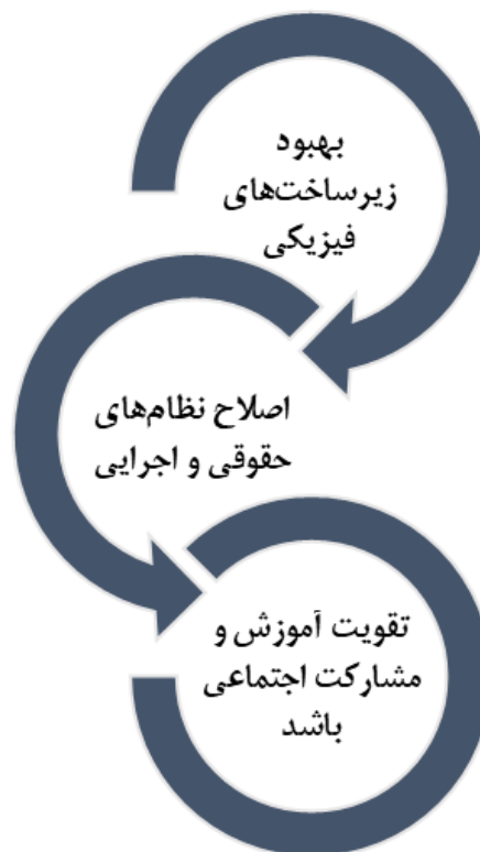
شکل ۱: رویکرد چند بُعدی ارتقای سلامت شهری مأخذ: (نگارنده، ۱۴۰۴).

مرور ۱۴ پژوهش انجام شده در حوزه سلامت شهری نشان می‌دهد که سلامت شهروندان تحت تأثیر عوامل متعددی از جمله کیفیت محیط‌زیست (آلودگی هوا، صوتی، مسکن، ترافیک)، دسترسی به زیرساخت‌های بهداشتی (فضاهای سبز، حمل‌ونقل عمومی، خدمات بهداشتی) و مداخلات اجتماعی (مشارکت شهروندان، آموزش و رسانه‌ها) قرار دارد. بخش قابل توجهی از پژوهش‌ها نیز به ابعاد حقوقی سلامت شهری پرداخته‌اند و کاستی‌های موجود در قوانین مرتبط با مدیریت پسماند، بحران، آب و فاضلاب، ایمنی و ایمنی غذایی را شناسایی کرده‌اند. نتایج این مطالعات بر ضرورت اصلاح و به‌روزرسانی قوانین، تقویت رویکردهای پیشگیرانه و ایجاد چارچوب‌های حقوقی جامع تأکید دارند. در مجموع، یافته‌ها حاکی از آن است که ارتقای سلامت شهری نیازمند یک رویکرد چندبُعدی است که هم‌زمان شامل موارد ذیل است: