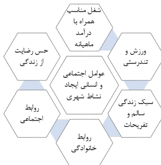
نمودار ۲. عوامل اجتماعی و اقتصادی توسعه نشاط شهری

متغیرهای تأثیرگذار در نشاط شهری به دو بخش عمده امور اجتماعی و اقتصادی دسته‌بندی می‌شوند.