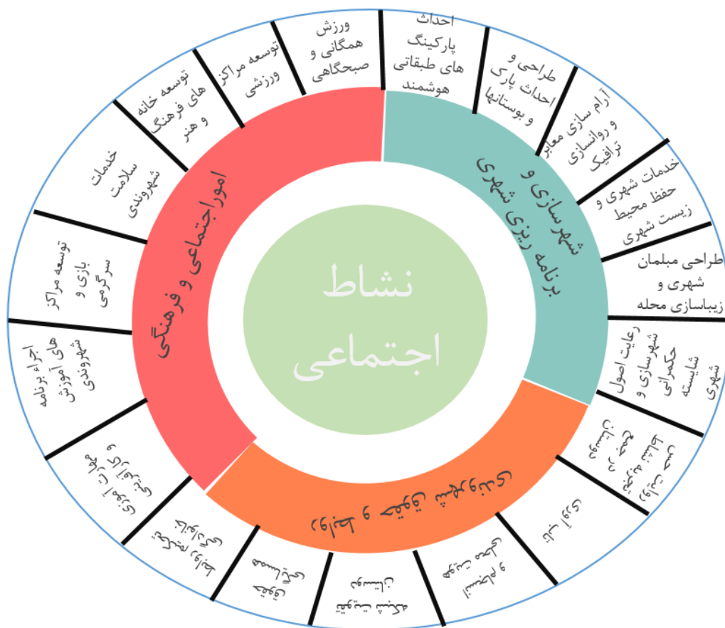
نمودار ۵- مدل توسعه نشاط اجتماعی حاصل از طی کردن ۷ گام فراتر ترکیب