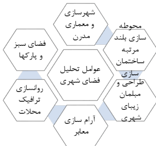
نمودار ۱. عوامل تحلیل فضای توسعه نشاط شهری

نشاط شهری و انسجام اجتماعی هر دو مزایای متعددی را در شهرها به همراه دارد. در حالی که بحث شده است که نشاط شهری - سرزندگی شهرها - ممکن است اتحاد و انسجام جامعه را تقویت کند؛ اما این به اندازه کافی توسط تحقیقات تجربی مورد بررسی قرار نگرفته است. تحقیقات نشان داده عوامل متعددی در ایجاد نشاط شهری مشارکت دارند که این عوامل شامل: شهرسازی و معماری مدرن به همراه محوطه‌سازی بلندمرتبه ساختمان‌ها و طراحی و مبلمان زیبای شهری، رنگ‌آمیزی خلاقانه و ترکیبی، آرام‌سازی معابر و روان‌سازی ترافیک محلات، طراحی سازه‌های چندمنظوره شهری با رعایت مهندسی ارزش، فضای سبز و پارک‌ها و پارکینگ‌سازی طبقاتی می‌تواند از جنبه‌های فنی و مهندسی در ایجاد سرزندگی شهری ایفاء نقش کند. همچنین رنگ‌آمیزی در ایجاد نشاط بصری برای شهروندان نقش مهمی ایفاء می‌کند و در صورتی که سپرهای کاهش آلودگی صوتی نیز در اتوبان‌ها و بزرگراه‌ها نصب شود این امر پررنگ‌تر می‌شود. این مشاهدات در برخی نقاط شهر اسلو تجربه شده است و در برخی نقاط دیگر نیز در حال ساخت‌وساز است. (Mouratidis, 2020)