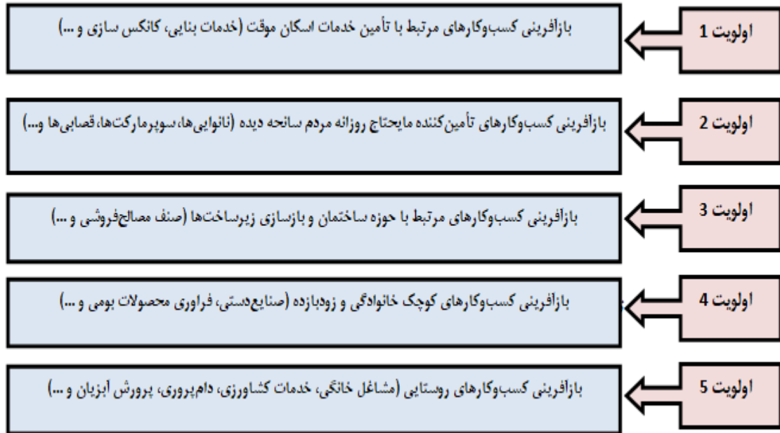
تصویر ۳. اولویت‌بندی کسب‌وکارها برای بازآفرینی (یافته‌های پژوهش)

ضربه روحی و روانی سنگینی به آن‌ها وارد می‌نماید. همچنین توجه به کسب‌وکارهای کوچک خانوادگی که نقش بسزایی در پایداری معیشت خانواده دارد، ضرورتی انکارناپذیر است. افزون بر این، نقش زنان در مشاغل خانگی بسیار حائز اهمیت است که ضرورت دارد برای این گروه از کسب‌وکارها، به جهت بازگشت سانحه دیدگان به زندگی و تزریق امید به آن‌ها، اقدامات مجزا و مؤثری صورت پذیرد. از سوی دیگر، جهت حمایت از کسب‌وکارهای مذکور، اختصاص تسهیلات با بهره بسیار اندک و یا حتی بدون بهره، می‌تواند در بازآفرینی آن‌ها تأثیر بسزایی داشته باشد.