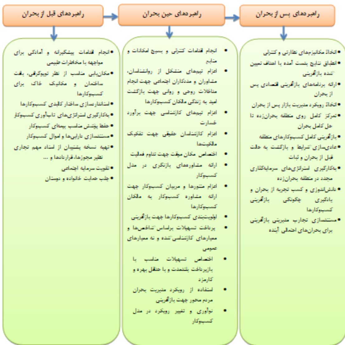
تصویر ۴. الگوی فرایندی بازآفرینی کسب‌وکارهای آسیب‌دیده از بحران زلزله (یافته‌های پژوهش)

همان‌گونه که در تصویر شماره ۴ ملاحظه می‌شود، الگوی فرایندی بومی جهت بازآفرینی کسب‌وکارهای آسیب‌دیده و تخریب‌شده پس از بحران زلزله سرپل ذهاب، مشتمل بر سه مرحله قبل، حین و پس از بحران است. هریک از مراحل فوق، مشتمل بر اتخاذ تصمیمات و انجام اقدامات و فعالیت‌هایی است که در هر مرحله از بحران می‌باید در دستور کار متولیان امر بازآفرینی و مالکان کسب‌وکارها قرار گیرد. به عنوان مثال؛ قبل از اینکه یک بحران طبیعی به وقوع بپیوندد، راهنم‌دهایی نظیر انجام اقدامات پیشگیرانه و آمادگی برای مواجهه با بحران‌های طبیعی، مکان‌یابی مناسب از نظر توپوگرافی، بافت ساختمان و مکانیک خاک برای کسب‌وکارها، استانداردسازی ساختار کالبدی کسب‌وکارها، به‌کارگیری راهنم‌دهای تاب‌آوری کسب‌وکار، حفظ پوشش مناسب بیمه‌ای کسب‌وکار، مستندسازی دارایی‌ها و اموال کسب‌وکار، تهیه نسخه پشتیبان از اسناد مهم تجاری نظیر مجوزها، قرارداده‌ها و ...، تقویت سرمایه اجتماعی و جلب حمایت دوستان و خانواده به‌عنوان راهنم‌دهای پیشگیری، قبل از وقوع بحران می‌تواند سازنده باشد. براساس یافته‌های پژوهش، چنانچه اقدامات پیشنهادی قبل، حین و پس از وقوع بحران اتخاذ گردد، می‌تواند از حجم خسارت‌های احتمالی بکاهد.