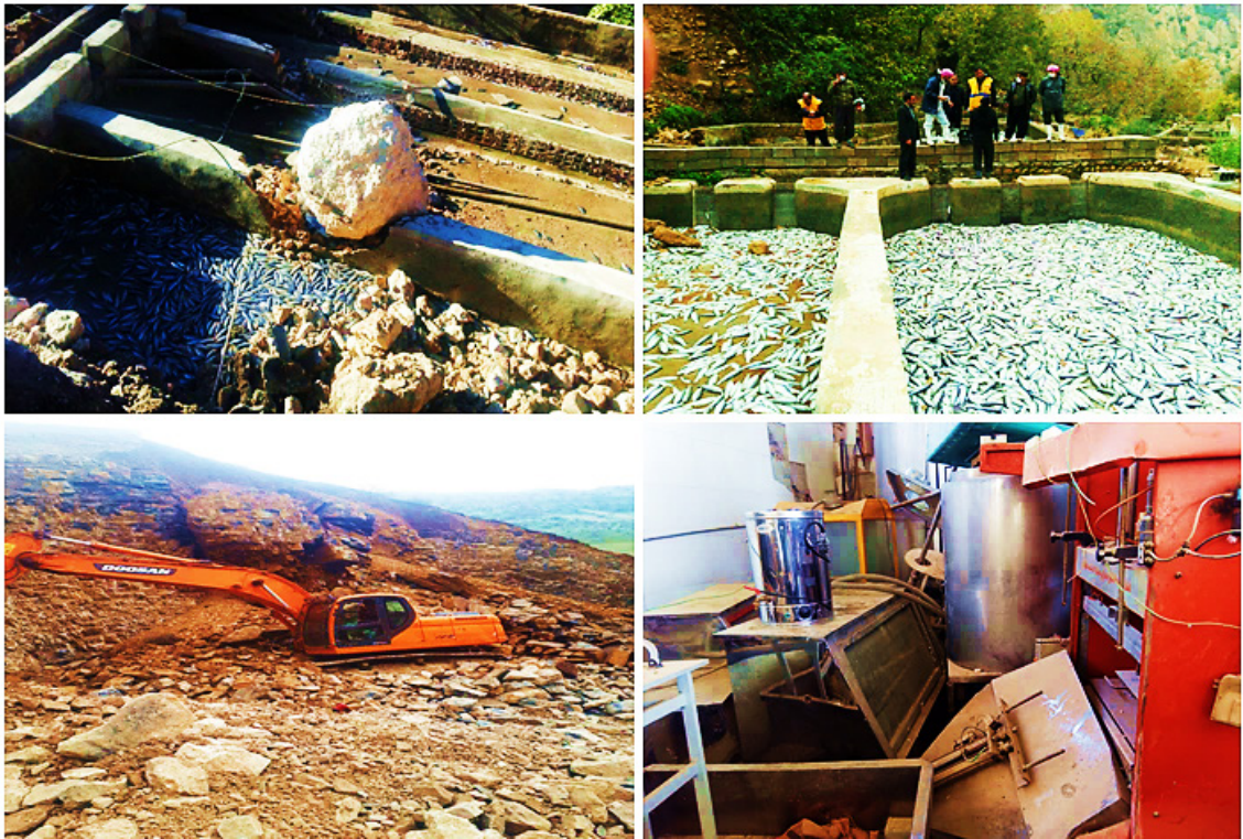
تصویر ۱. خسارت زلزله به مزارع پرورش ماهی در شهر ریجاب، شرکت تولید آسفالت در ثلاث باباجانی و شرکت لبنیاتی در سرپل ذهاب

از این رو، مشکل بازآفرینی کسب و کارها برای بازماندگان از زلزله، بلافاصله پس از وقوع زلزله شروع می‌شود. با این حال، بازسازی صرفاً مشمول ساختمان‌ها و تأسیسات زیربنایی می‌شود و بازآفرینی کسب و کار مورد غفلت قرار می‌گیرد و در نتیجه اشتغال و تأمین معیشت پایدار در این گونه حوادث مهیب، در کمترین رتبه توجه سازمان‌های دولتی و به‌ویژه سازمان‌های مردم‌نهاد بوده است. از آنجا که متولیان امر بازسازی معمولاً به انجام کارهای ملموس و قابل دیده شدن توسط عامه مردم علاقه دارند، در فرآیند کمک‌رسانی‌ها، کمتر اثری از توجه به بازآفرینی کسب و کارها و اجرای طرح‌های اشتغال‌زا و درآمدزا، درس‌آموزی از تجارب گذشته و پژوهش‌ها دیده می‌شود. توجه خاص به اشتغال‌زایی در مناطق حادثه‌دیده، می‌تواند وجهی از رهیافت «مدیریت بحران اجتماع‌محور» بشمار آید. این رهیافت بر توانمندسازی آسیب‌دیدگان و پرهیز از رفتار کمک‌کننده-کمک‌گیرنده دلالت دارد؛ رفتاری که معمولاً منجر به تضعیف اعتمادبه‌نفس کمک‌گیرندگان تا حد روحیه تکدی‌گری می‌شود (ایرانمنش، ۱۳۹۶: ۱۹ و ۴۶). با توجه به مطالبی که ذکر گردید، مخاطرات طبیعی از جمله زلزله، تأثیرات مخرب بر روی انواع کسب و کارها به‌ویژه کسب و کارهای کوچک برجای می‌گذارند. در برخی موارد، این تأثیر آن قدر شدید است که برای مدت‌ها در روند فعالیت کسب و کارها وقفه طولانی مدت ایجاد می‌شود. در