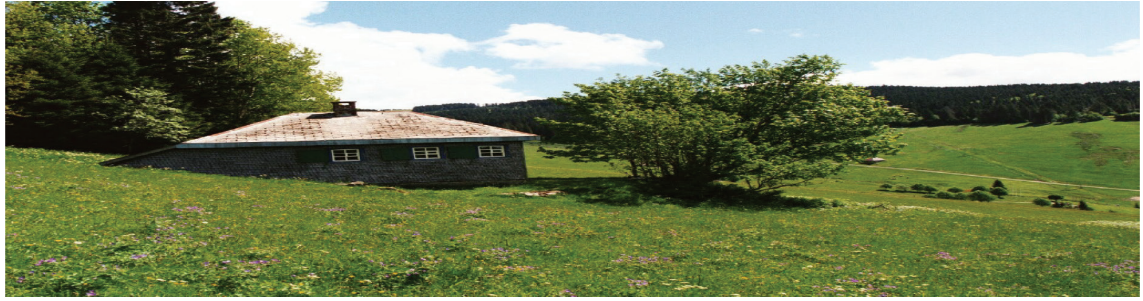
تصویر ۶. کلبه روستایی و مسکن مطلوب هایدگر

ارزش‌گذاری خصایص برجسته و یا تحلیل علت راحتی آنها نیست بلکه برعکس، بایستی از توصیف، پافرا تر نهیم - چه توصیف عینی چه ذهنی - یعنی آنکه آیا این توصیفات بیانگر حقایق است یا احساسات.» (باشلار، ۱۳۹۲، ص. ۴۴) باشلار معتقد به مکان‌کاوی بود. او معنای مکان را در در عرصه‌های زندگی خصوصی انسان درک کرده بود و تنها راه دریافت شناخت از این فضا را کاوش در ضمیر ناخودآگاه ساکنین آن می‌دانند. چنین دست مطالعات روان‌شناسی در فضای مسکونی از آن جهت حائز اهمیت است که دیدگاه محققان در این زمینه را با نوعی از فضای جدید معماری آشنا می‌سازد که مولفه‌های سازنده آن تنها ابعاد فیزیکی و زیبایی شناسانه نبوده، بلکه تا حدود زیادی بار اجتماعی و روانی را در بردارد.