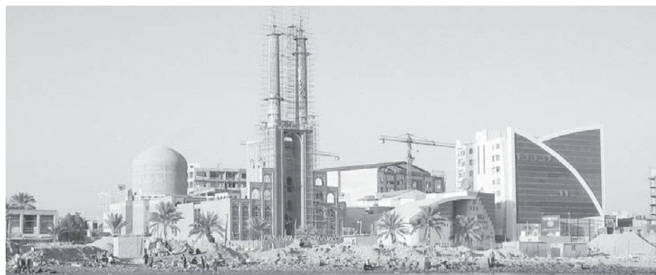
تصویر ۳. سبک‌های متفاوت و همجواری ناسازگار معماری در ساحل بندرعباس؛ ماخذ: نگارندگان، آذر ۱۳۸۹.