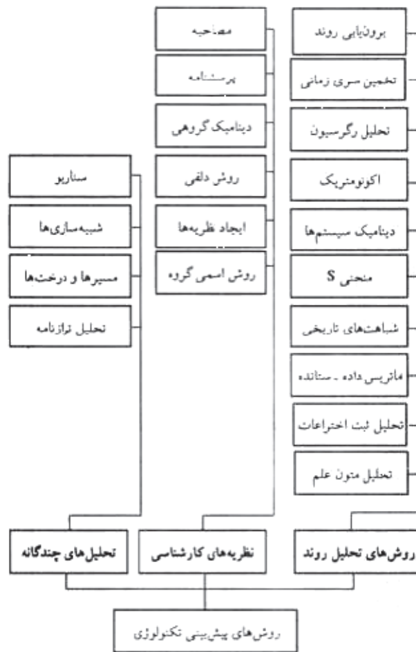
نمودار ۱. روش‌های پیش‌بینی تکنولوژی؛ ماخذ: نگارنده.

آغاز طراحی تا ساخته شدن نخستین نمونه محصول بطول می‌انجامید. در نتیجه فناوری بکارگرفته شده در آغاز طراحی، در طول پیشرفت پروژه دچار تغییرات بنیادین شده و اغلب در برهه ساخت نمونه نخستین، از رده خارج محسوب می‌شد. در سال ۱۹۶۴ نیاز به پیش‌بینی فناوری، منجر به انجام یکی از مشهورترین ارزیابی‌ها با استفاده از روش دلفی گردید. در چارچوب حمایت‌های بنیاد رندا ۱ ، خبرگان فناوری‌های مختلف طی یک پروژه مشترک مامور شدند که فناوری‌های نوظهور در یکصد سال آینده را پیش‌بینی نمایند. بررسی آنان شش مقوله «دگرگونی‌های پراهمیت علمی»، «مهار جمعیت»، «توماسیون»، «پیشرفت در زمینه دانش هوافضا»، «جلوگیری از جنگ» و «سامانه‌های جنگی» را شامل می‌شد. این روش از افراد می‌خواست که ضمن ارائه ارزیابی خود، پراکندگی پاسخ‌های سایر خبرگان را نیز در نظر گرفته و پس از بحث در مورد تفاوت‌ها، نهایتاً ارزیابی‌های بازنگری شده خود را ارائه کنند. نتایج این روش به طرز شگفت‌انگیزی در پیش‌بینی ظهور فناوری‌های دهه‌های پسین، دقیق بود. آینده‌پژوهی در مقام یک فعالیت عمومی از دهه شصت آغاز شد. «برتراند دوژوئل» ۲ نخستین پژوهش نظری در مورد آینده را بنام «هنر گمان» نوشت. او در این زمینه با اشاره به این که «هیچ واقعیتی در مورد آینده وجود ندارد»، نتیجه گرفت که یافتن مدارک و استنتاجات برای آینده، نیازمند