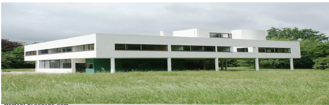
تصویر ۷. ویلای ساوا، اثر لوکوربوزیه. از چیستی مسکن به کیستی مسکن: از ویلای ساوا به معمار آن: لوکوربوزیه؛ ماخذ: نگارنده رساله؛ ماخذ: تصویرک وبلاگ معماری بلاگ پارس، زمان برداشت: ۱۳۹۶.

هر انسانی منسوب به تجربه او از زادگاه خودش است. بعبارت دیگر چنانچه تفسیری چه نوشتاری و چه گفتاری در خصوص خانه مطرح شود. هر شخصی ابتدا آن موضوع را با برداشت‌های ذهنی خود