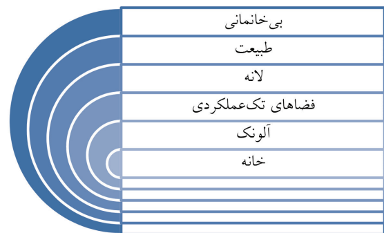
نمودار ۱. ابعاد روند سکونت زیستی بشر؛ ماخذ: نگارندگان.

کیفیت مسکن زیرمجموعه‌ای از کیفیت زندگی است. کیفیت زندگی به جنبه‌های کمی و کیفی توأم می‌پردازد. کیفیت زندگی بدون کیفیت محیطی که در آن زندگی می‌کنیم معنایی ندارد، بنابراین می‌توان گفت «کیفیت مسکن یک قسمت از کیفیت زندگی است و شامل تمام فاکتورهایی می‌شود که بخشی از رضایت‌مندی انسان‌ها را تشکیل می‌دهند.» کیفیت محیط شهری در توجه توأم به جنبه‌های کیفی و کمی عناصر شهری و اجزای تشکیل‌دهنده آن‌ها نهفته است. برنامه‌ریزان معتقدند کیفیت محیط یک مفهوم اصلی برای برنامه‌ریزی منطقه‌ای و اجتماعی است و با مفاهیمی همچون کیفیت زندگی، تنوع فضای اجتماعی، ویژگی‌های فیزیکی، فعالیت‌ها،