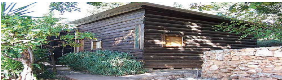
تصویر ۸. کلبه شخصی لوکوربوزیه؛ در سواحل جنوبی فرانسه.

تکامل می‌یابند و اگر در خانه معینی سکونت داشته باشند مایل‌اند آنرا مطابق این تحول و کمال متحول سازند. قسمت‌هایی را به آن ملحق نمایند و یا آنرا تغییر دهند. کوپر چنین تحولی را در خانه یونگ مثال می‌زند: «در سال ۱۹۳۳ اولین خانه مدور را ساخت. آن خانه کانون گرم مادرانه‌ای را به او ارزانی داشت. لذا چهارسال بعد یک قسمت الحاقی به آن افزود. چهارسال بعد او احساس کرد نیاز دارد اتاقی مجزا برای خلوت و مراقبه به ساختمان بیافزاید جایی که هیچ‌کس نتواند به آنجا وارد شود و گوشه خلوتی برای تمرکز معنوی باشد. پس از گذشت چهارسال دیگر احساس کرد به فضای دیگری احتیاج دارد. مکانی که به سوی آسمان و طبیعت گشوده شده باشد. بنابراین یک حیاط و یک ایوان سرپوشیده را نیز به ساختمان اضافه کرد. نهایتاً پس از مرگ همسرش الزامی درونی احساس کرد مبنی بر اینکه (آنچه خودم هستم بشوم) و لذا آن بخش کوچک و مرکزی خانه را مورد توجه قرارداد ..... درون آن من در کانون زندگی حقیقی خود بودم. من واقعا خودم بودم. از همان ابتدا ساختمان را به نوعی همچون مکانی برای رشد و تکامل احساس می‌کردم. یک رحم مادرگونه یا شبه مادرانه از آنچه می‌توانستم باشم. آنچه بودم هستم و خواهم بود. احساس می‌کردم دوباره از درون سنگ‌ها متولد شده‌ام. بنابراین آن بنا تجسم فرایندی فردی است.»