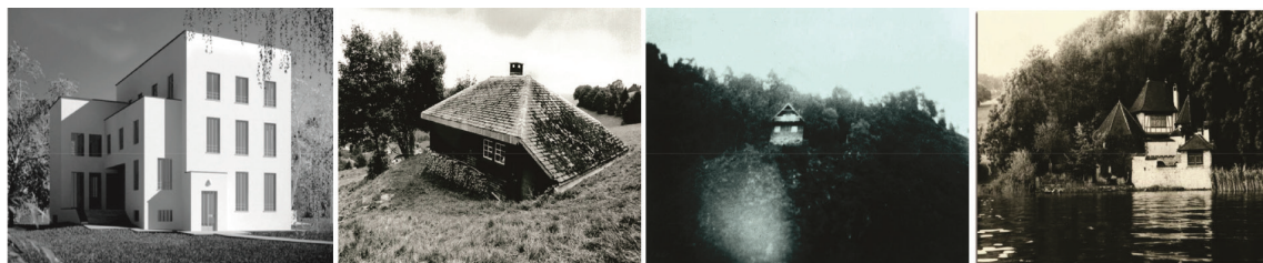
از راست به چپ: کارل گوستاو بونگ - برج بولینگن بر ساحل دریاچه زوریخ، لوئویگ وینگشتاین - کلیه ای در شلون، مارتین هایگر - کلیه ای در جنگل سیاه، لوئویگ وینگشتاین - خانه ای در وین

تصاویر ۱ الی ۴. نمونه هایی از خانه معروف در تاریخ معماری؛ ماخذ: مهدوی نژاد، ۱۳۹۰.