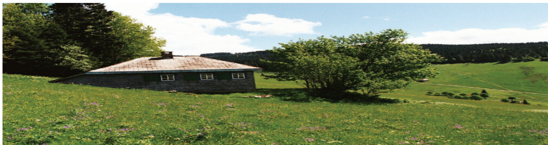
تصویر ۶. کلبه روستایی و مسکن مطلوب هایدگر

ارزش‌گذاری خصایص برجسته و یا تحلیل علت راحتی آنها نیست بلکه برعکس، بایستی از توصیف، پافرا تر نهیم - چه توصیف عینی چه ذهنی - یعنی آنکه آیا این توصیفات بیانگر حقایق است یا احساسات» (باشلار، ۱۳۹۲، ص. ۴۴) باشلار معتقد به مکان‌کاوی بود. او معنای مکان را در در عرصه‌های زندگی خصوصی انسان درک کرده بود و تنها راه دریافت شناخت از این فضا را کاوش در ضمیر ناخودآگاه ساکنین آن می‌دانند. چنین دست مطالعات روان‌شناسی در فضای مسکونی از آن جهت حائز اهمیت است که دیدگاه محققان در این زمینه را با نوعی از فضای جدید معماری آشنا می‌سازد که مولفه‌های سازنده آن تنها ابعاد فیزیکی و زیبایی شناسانه نبوده، بلکه تا حدود زیادی بار اجتماعی و روانی را در بردارد.