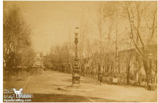
شکل ۱. خیابان باب همایون