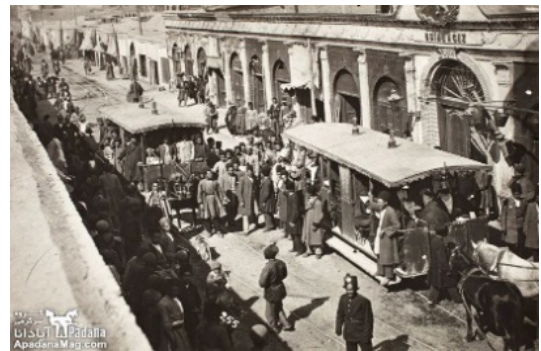
شکل ۳. خیابان چراغ گاز (امیر کبیر)

۲ - خیابان ناصریه (ناصرخسرو)؛ ۳ - خیابان چراغ گاز (امیرکبیر)؛ ۴ - خیابان لاله زار؛ ۵ - خیابان علاء الدوله (فردوسی)؛ ۶ - خیابان باغشاه (سپه) (مهدیزاده، ۱۳۸۱، ص ۲۲).