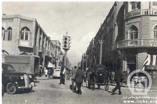
شکل ۴. خیابان لاله زار