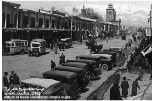
شکل ۲. خیابان ناصریه: ناصر خسرو